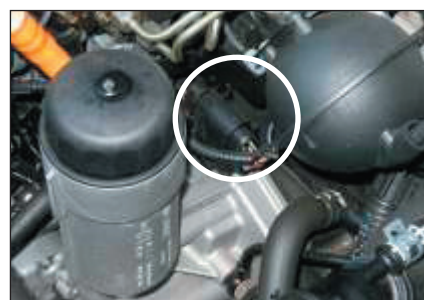
Billeder af tværliggende 1,9 TDI motor.

Du skal nu montere modulet ude i motorrummet. (Vær opmærksom på at montere det så det ikke bliver udsat for vand, vibration eller meget varme, da fabriksgarantien ikke dækker skader på modulet, som er forårsaget af dette). Vi anbefaler, at man ligger modulet i en plasticpose og lukker den sammen om kablet med en strips.